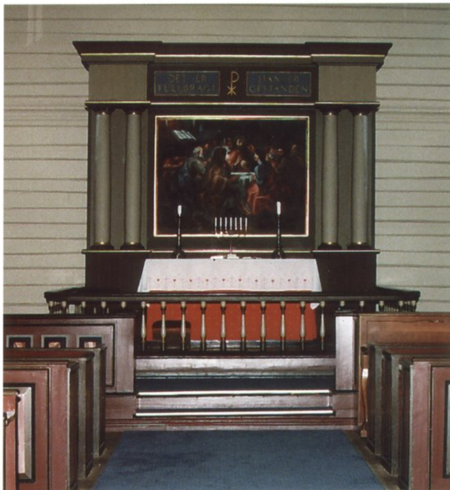
Altartavlen i Randesund Kirke fra 1925. Malt av Olav Hasaas (Kopi av altartavlen i Risør Kirke).

Randesund Kirke med 450 sitteplasser benyttes til: